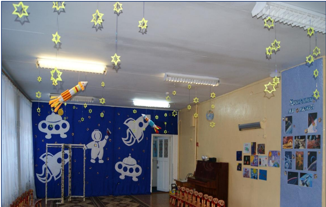
Вечный зов неведомых миров